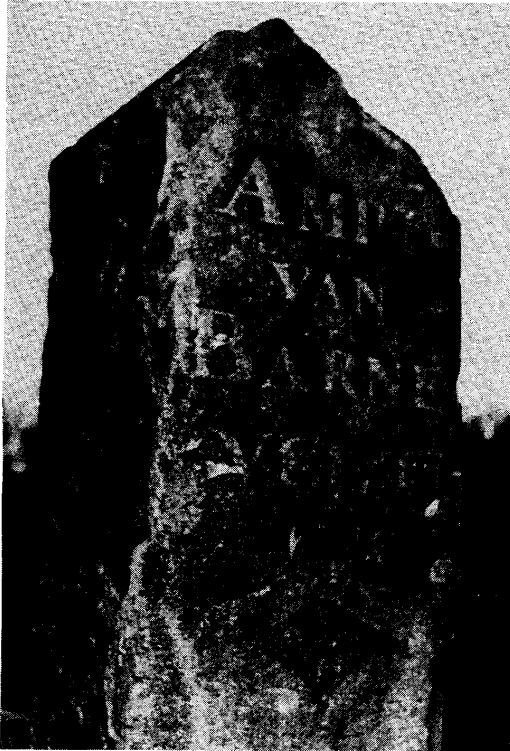
Fig. 1. Grenssteen.